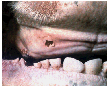
唇にできた水疱（水ぶくれ）